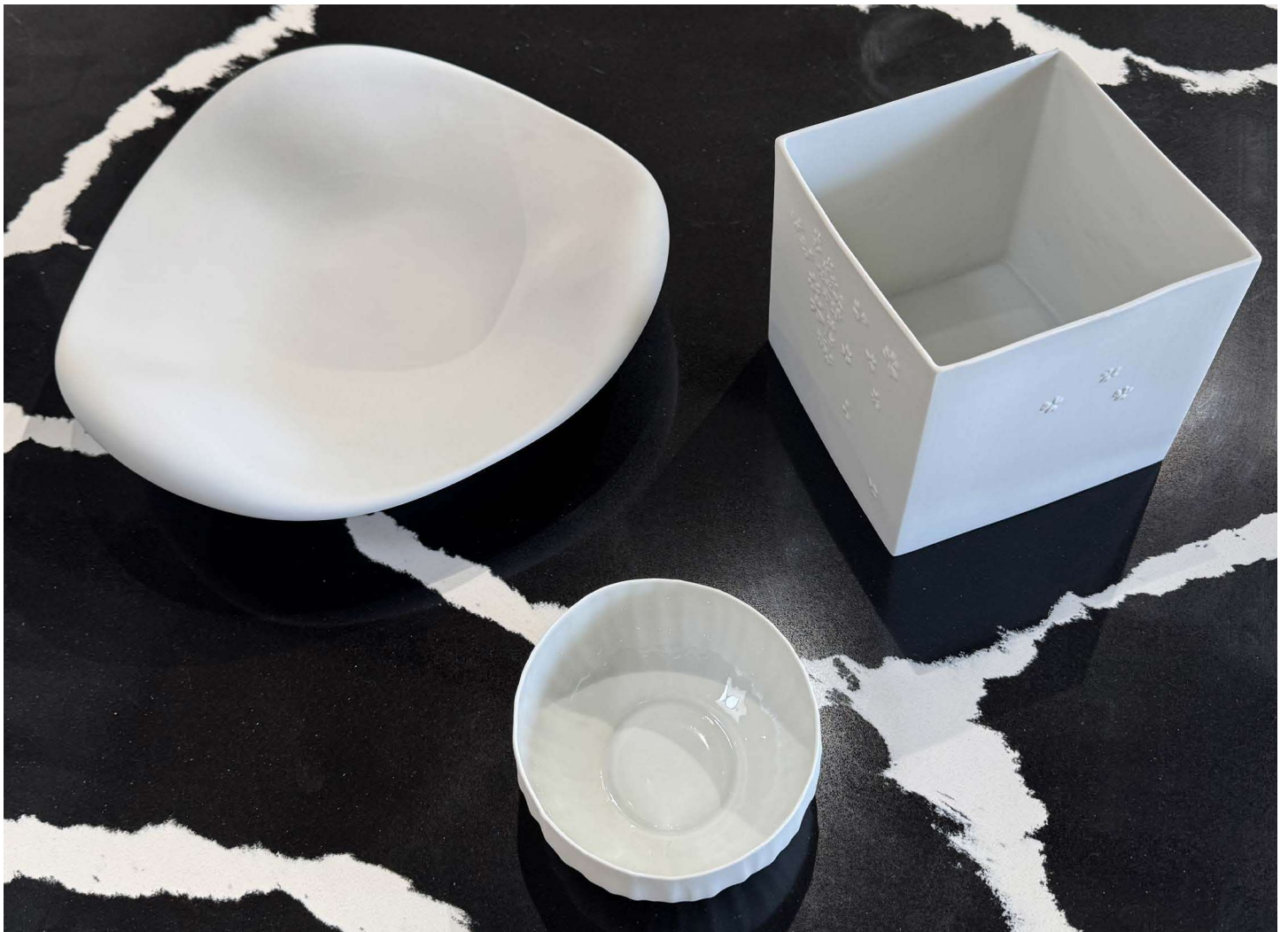
ZU190 assiette COUSSIN diam. 32cm ZA107 cache pot/vase ARBORESCENCE 14×14×14cm ZLO116 petit bol bombe LOTUS diam. 11 cm h. 6cm