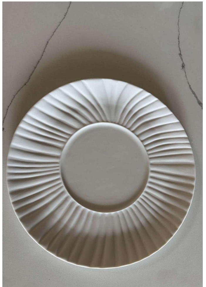
ZVER100 assiette VERSAILLES diam. 29 cm bassin 14 cm