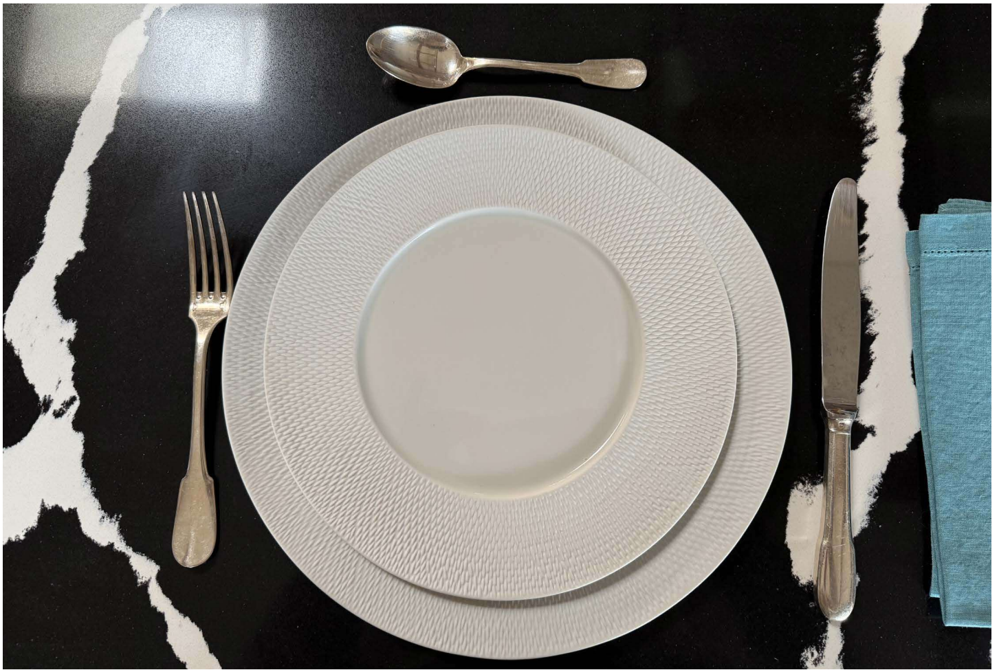
ZBAL107 assiette plate BALI diam. 27 cm bassin 16 cm ZBAL100 assiette présentation BALI diam. 31 cm bassin 16 cm