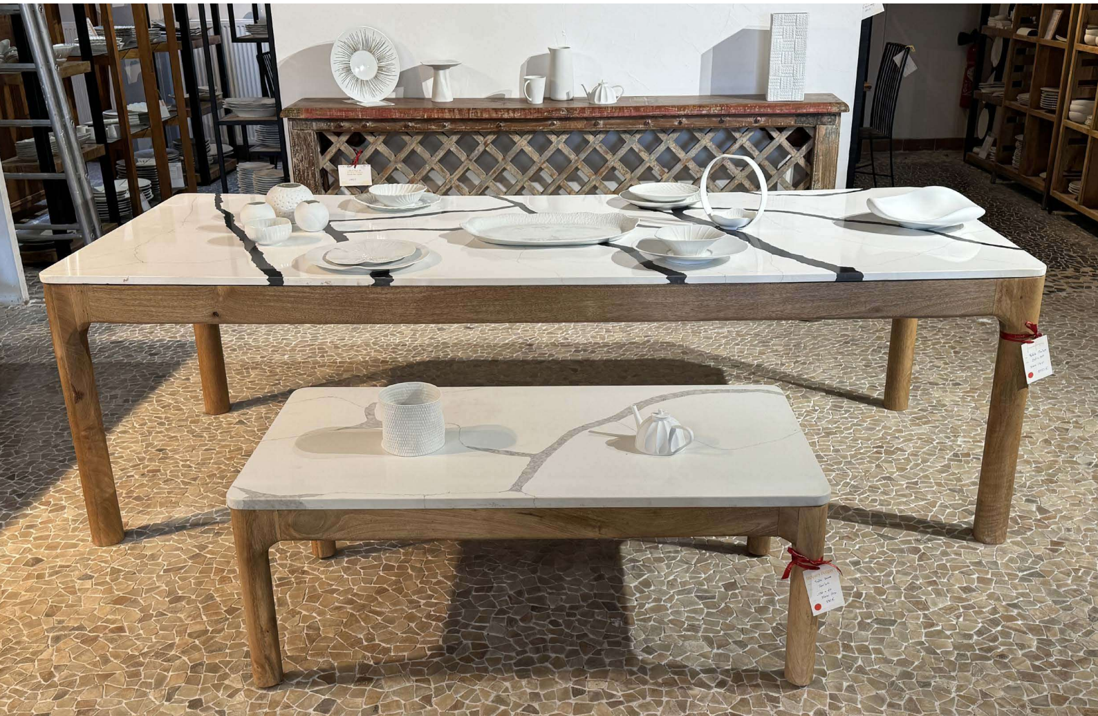
PMK240 table marbre 240×100 cm • Modèle table basse 120×60×45 cm, 130×70×45 cm et 50×50×50 cm • Modèle console 130×30×84 cm plateau blanc nervures noires / blanc nervures grises / noir nervures blanches, base bois manguier