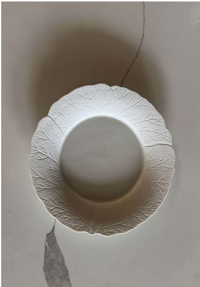
ZAUR100 assiette AURELIE diam. 27 cm