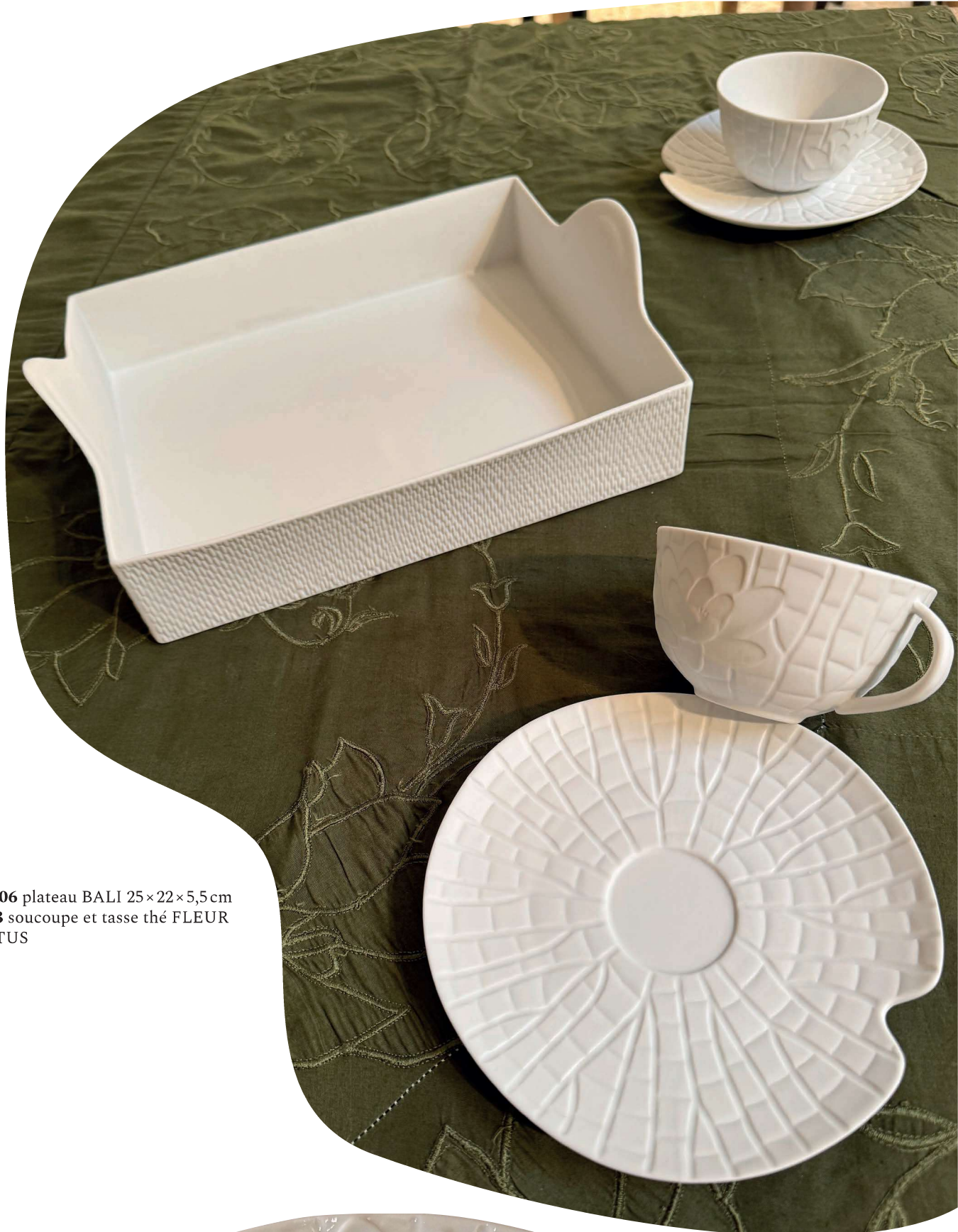
ZBAL106 plateau BALI 25×22×5,5 cm ZFL103 soucoupe et tasse thé FLEUR DE LOTUS