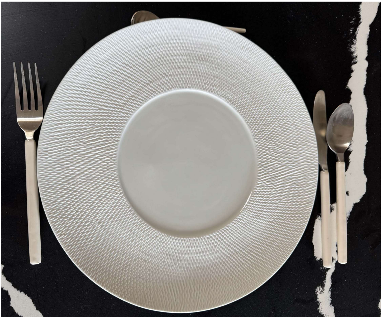
ZBAL100 assiette présentation BALI diam. 31 cm bassin 16 cm