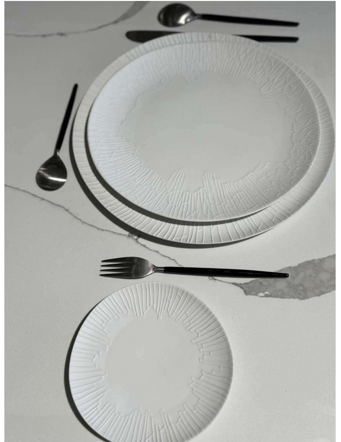
ZGL100 assiette GLACIER fond plat diam. 27 cm ZGL101 assiette GLACIER fond plat diam. 31 cm ZGL103 assiette à pain GLACIER diam. 15 cm