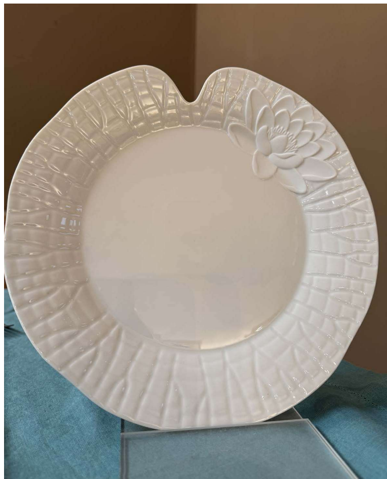
ZFL100 assiette dîner fond plat FLEUR DE LOTUS 27 cm