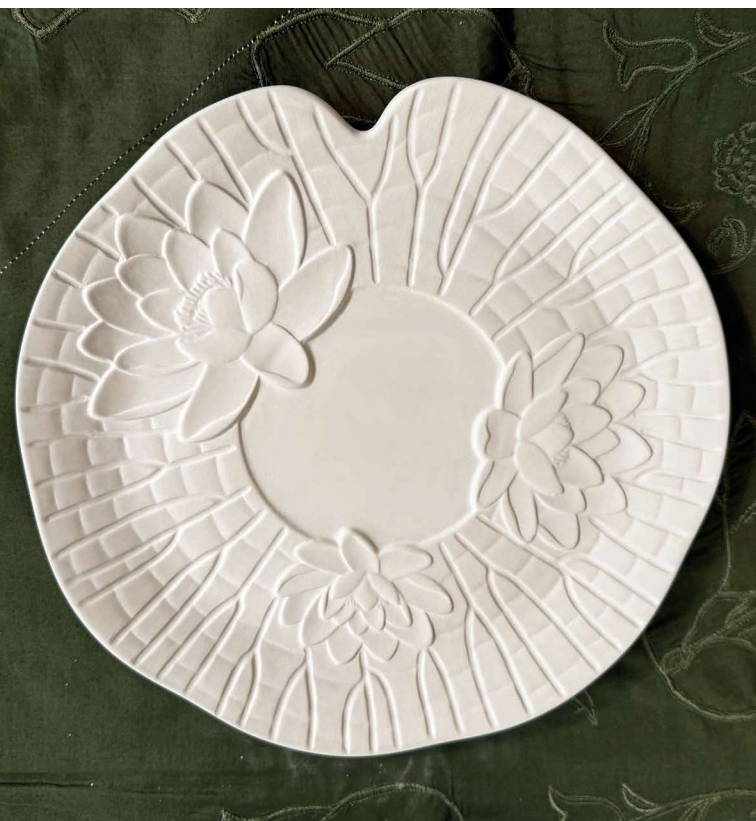
ZFL101 assiette dessert fond plat FLEUR DE LOTUS 22cm