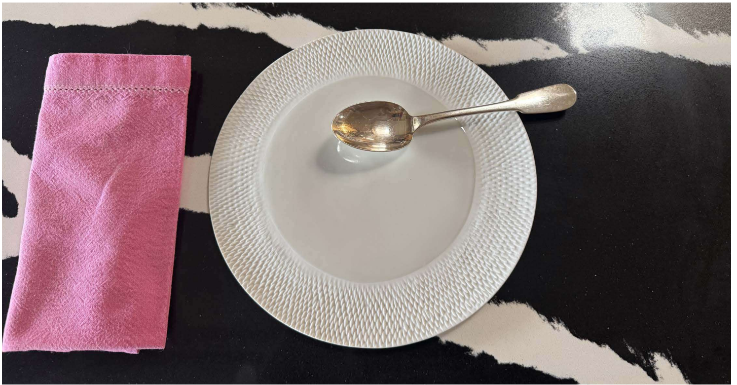
ZBAL102 assiette à dessert BALI diam. 22 cm