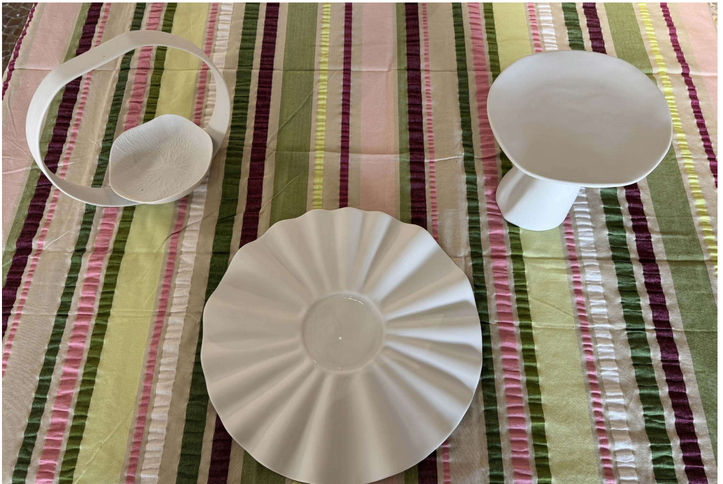
ZOP100 assiette OPERA diam. 30cm bassin 9cm • ZU160 BAOBAB diam. 17 cm h. 15 cm • ZU161 anneau diam. 21 cm h. 19,5 cm combiné avec ZSCM119 coupelle SMOCK diam. 12cm