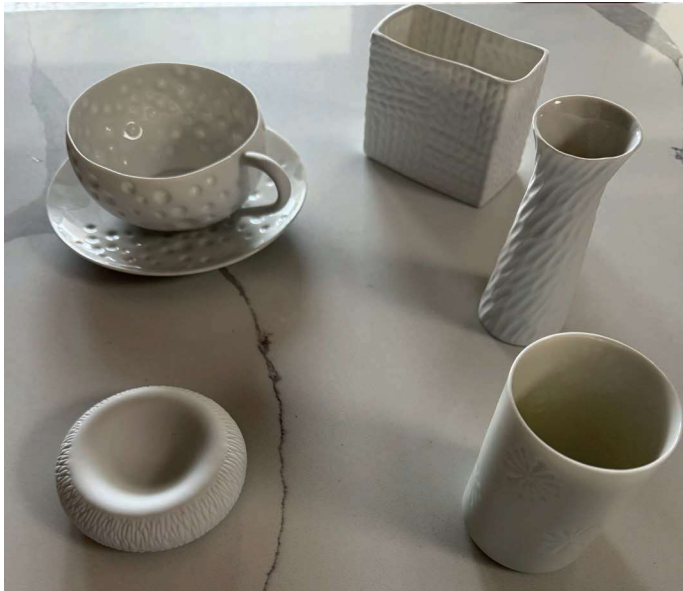
ZCOR103 tasse et soucoupe thé CORAIL 35 cl ZDUN152 support donut creux DUNES diam. 9 cm ZU163 timbale photophore FLOCONS diam. 6,2 cm h. 10,2 cm ZNA117 grande saucière/soliflore EMPREINTE diam. 4,5 cm h. 12 cm ZCADO159 petit vase-pot à grizzini/crayons TRICOT