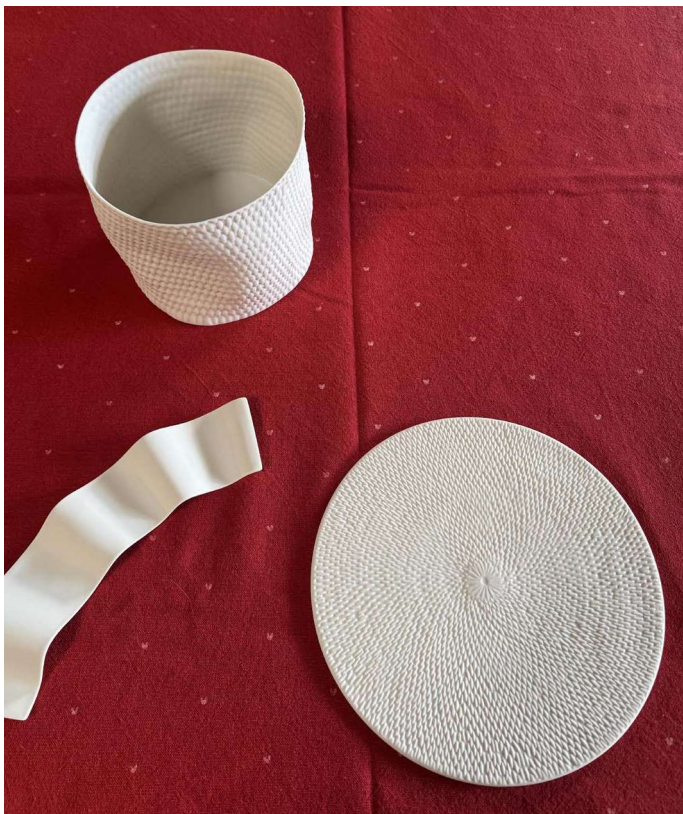
ZOP110 petite réglette fine OPERA 3 creux 24×5 cm • ZBAL104 panier à pain BALI • ZBAL105 dessous de plat BALI diam. 19-20 cm - existe en assiette à pain diam. 15 cm ZBAL103