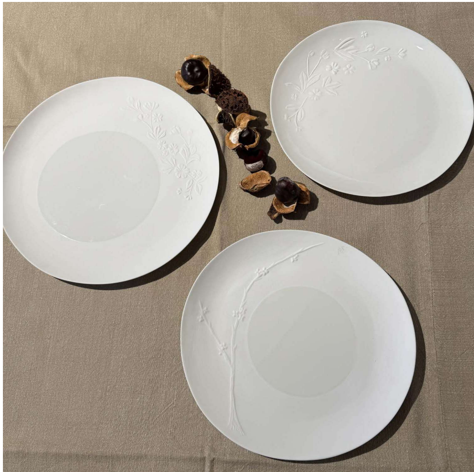
ZA099 assiette ARBORESCENCE cerisier fond plat diam. 31 cm ZA110 assiette ARBORESCENCE fleurs d'oranger fond plat diam. 27 cm