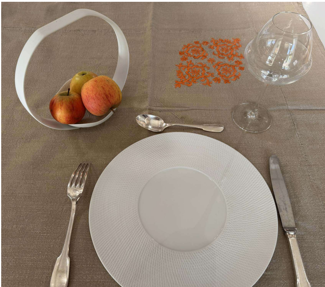
ZBAL101 assiette plate BALI diam. 29 cm bassin 14 cm ZU161 anneau diam. 21 cm h. 19,5 cm combiné avec ZSCM119 coupelle SMOCK diam. 12 cm