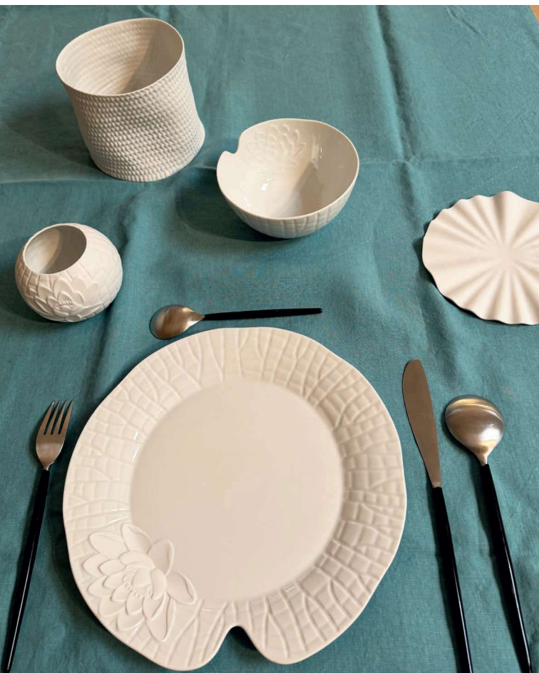
ZFL100 assiette dîner fond plat FLEUR DE LOTUS 27 cm ZFL102 bol 12cm FLEUR DE LOTUS ZFL104 vase boule FLEUR DE LOTUS 9 cm ZOP115 assiette à pain OPERA diam. 16cm ZBAL104 panier à pain BALI