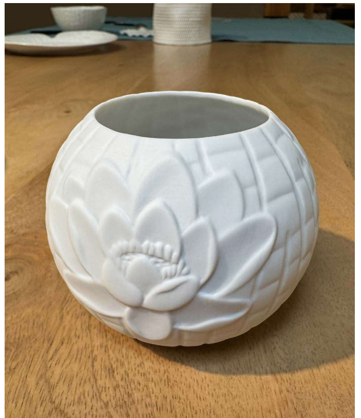
ZFL104 vase boule FLEUR DE LOTUS 9cm