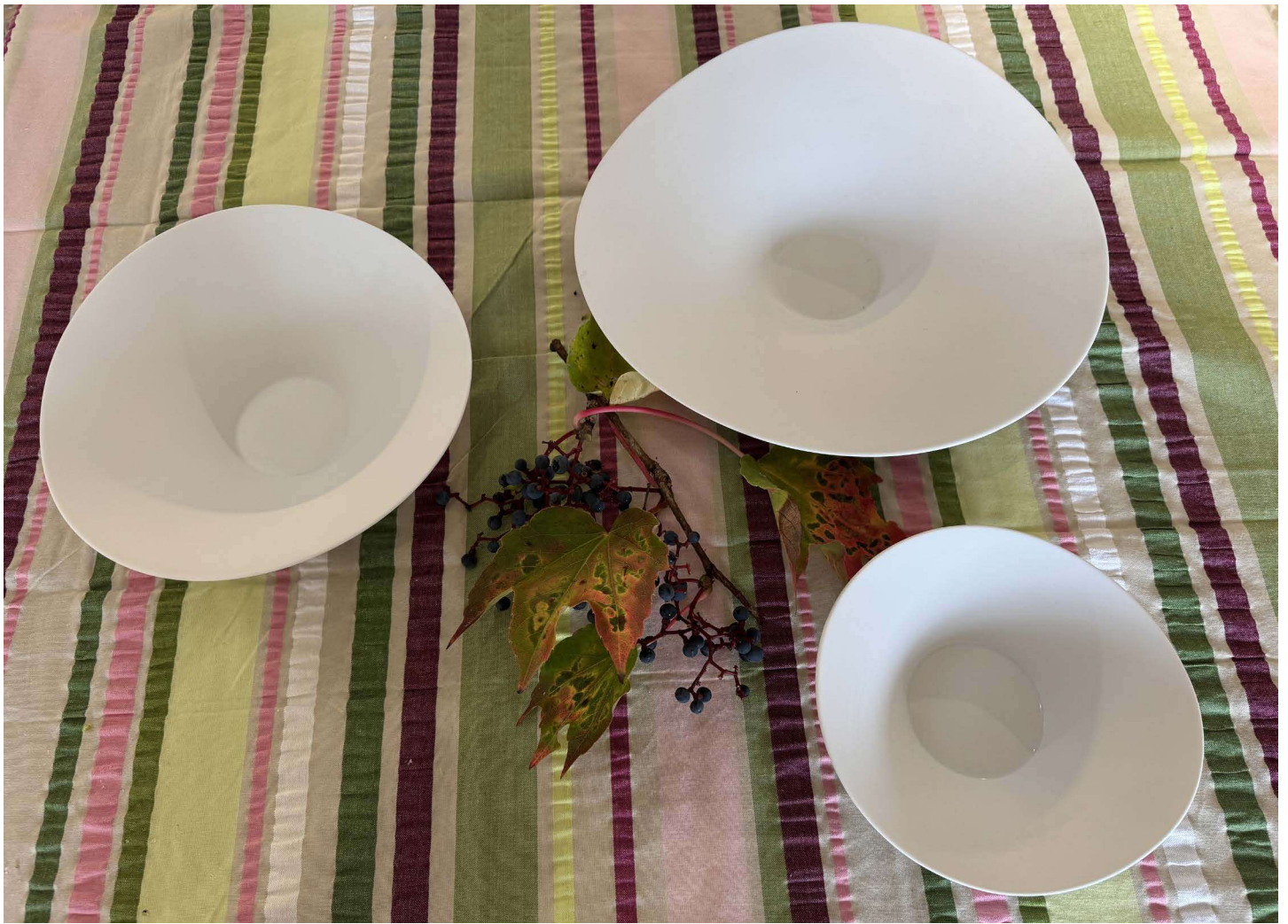
ZU140 coupe ENVOL fleur diam. 31 cm bassin 6 cm • ZU123 coupe ENVOL basse diam. 24 cm bassin 11 cm • ZU144 coupe ENVOL haute diam. 18 cm bassin 6 cm existe aussi en diam. 24 cm bassin 6 cm ZU122