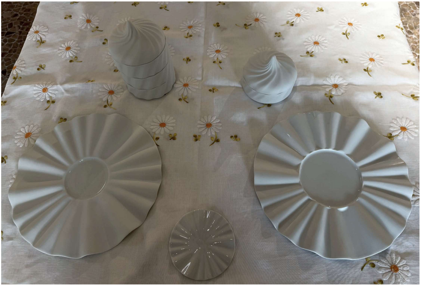
ZOP100 assiette OPERA diam. 30cm bassin 9 cm • ZOP101 assiette OPERA diam. 30cm bassin 11,5 cm ZOP114 assiette à pain OPERA diam. 12cm • ZTOR114 B/C/M Bentobox TORSADE 3 étages maximum