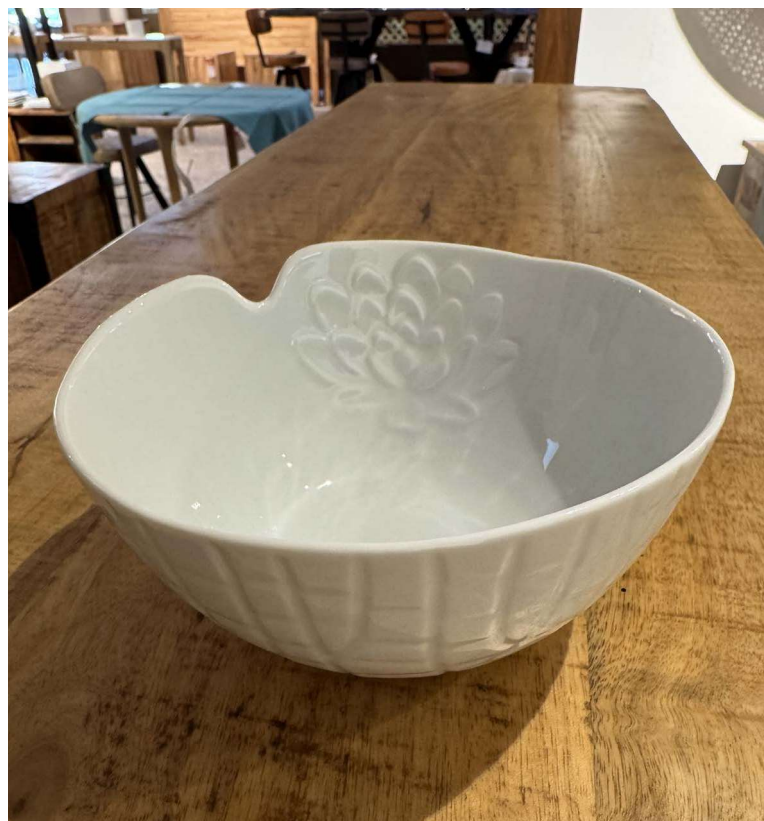
ZFL102 bol 12cm FLEUR DE LOTUS